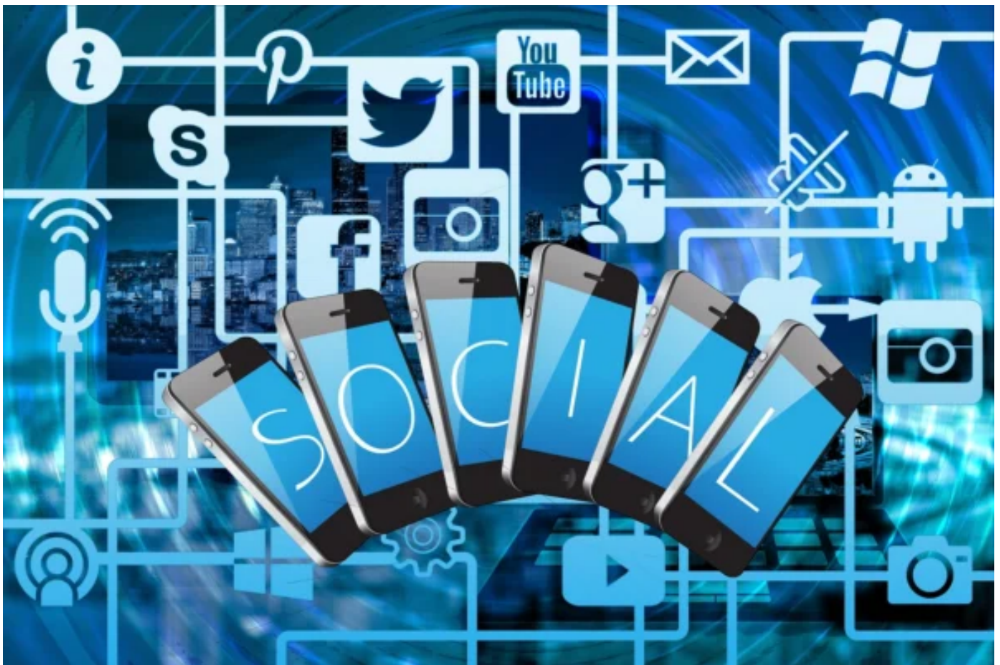
L'uso dei social network dal gioco alla politica