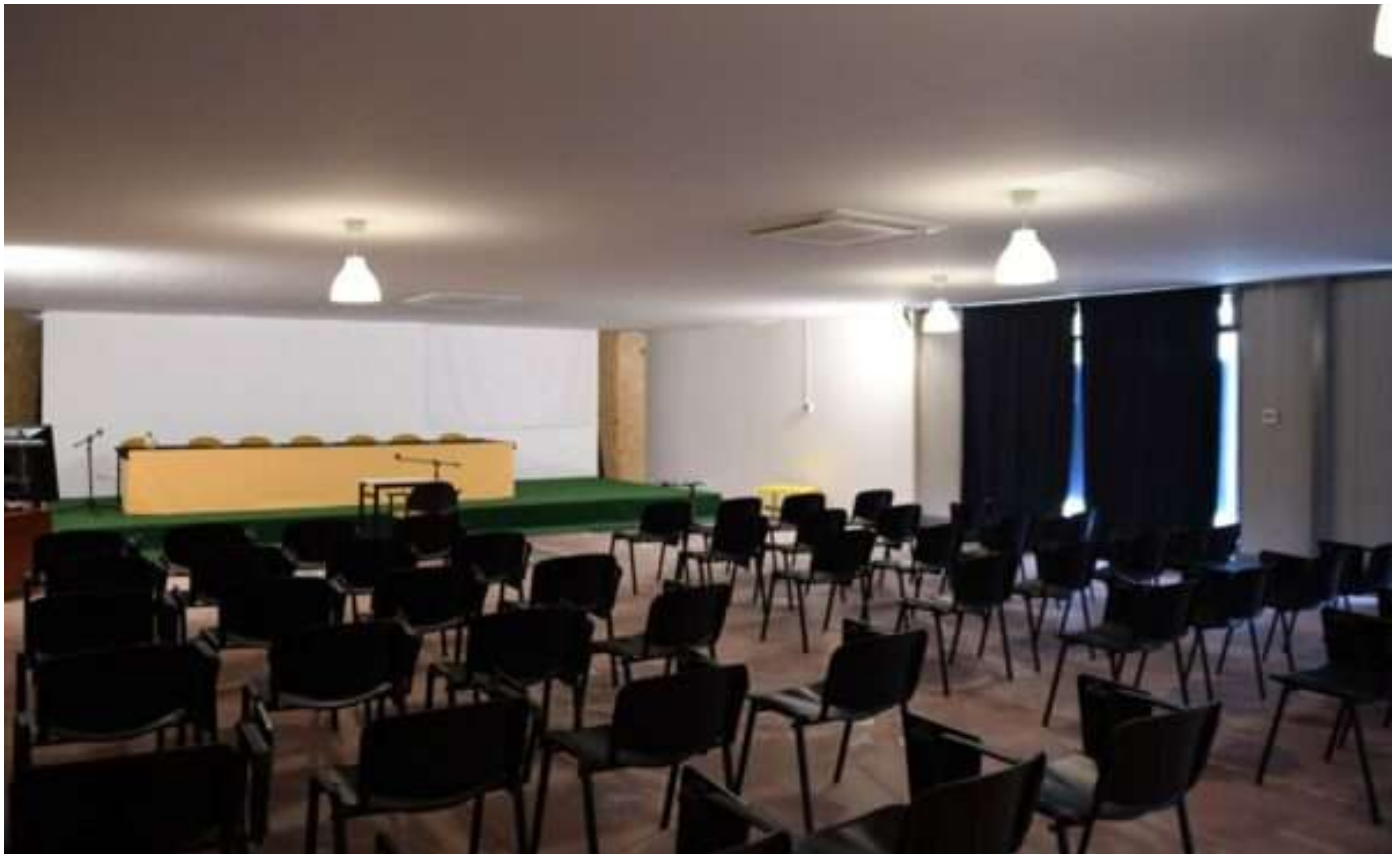
Formazione universitaria e continua: lo slow study